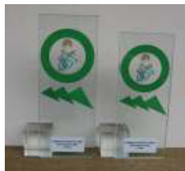
Glastrophäe „Gewehrshütze“ (gestiftet: www.cristallcup.de)