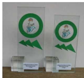
Glastrophäe „Gewehrshütze“ (gestiftet: www.cristallcup.de)